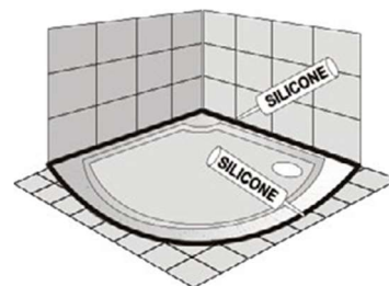
Zapuštěná do podlahy