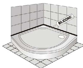
S čelním panelem

Vaničku neinstalujte tak, aby dlažba přesahovala vaničku - pouze přiložte ke stěně a silikonem utěsněte.