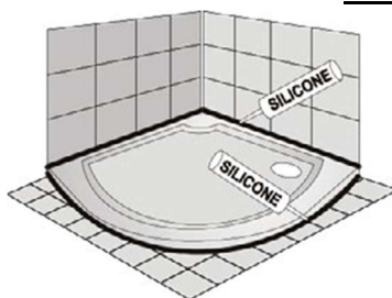
Usazená na podlaze